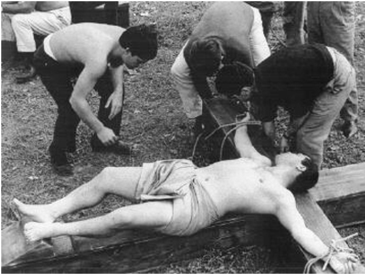
Un'altra fotografia scattata durante la lavorazione del film