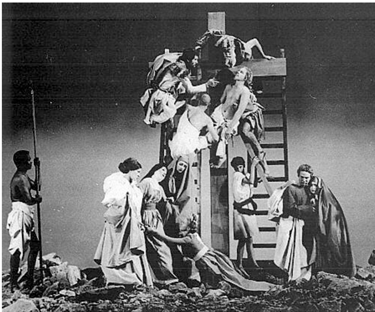
Fotografia di scena del film La ricotta : allestimento sulla base delle pale d'altare della Deposizione di Rosso Fiorentino e del Pontormo.

alcuni frame del videoart “(Post) Modern Times” di Brian Johnson