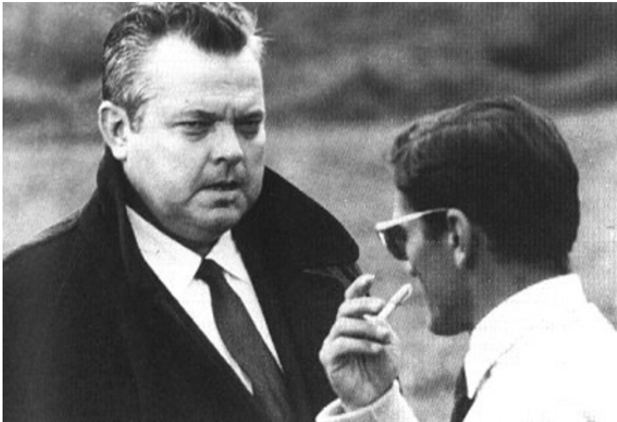
Orson Welles e Pier Paolo Pasolini durante la lavorazione del film La ricotta

Questo pomeriggio, presentiamo due proiezioni dalle quali il pensiero degli autori si alza con forza, si manifesta nelle straordinarie forme delle loro opere e provoca a sentire diversamente, a ripercorrere i luoghi del sapere e dell'arte, a rivedere i luoghi della certezza e della fede, ad adottare prospettive altre.