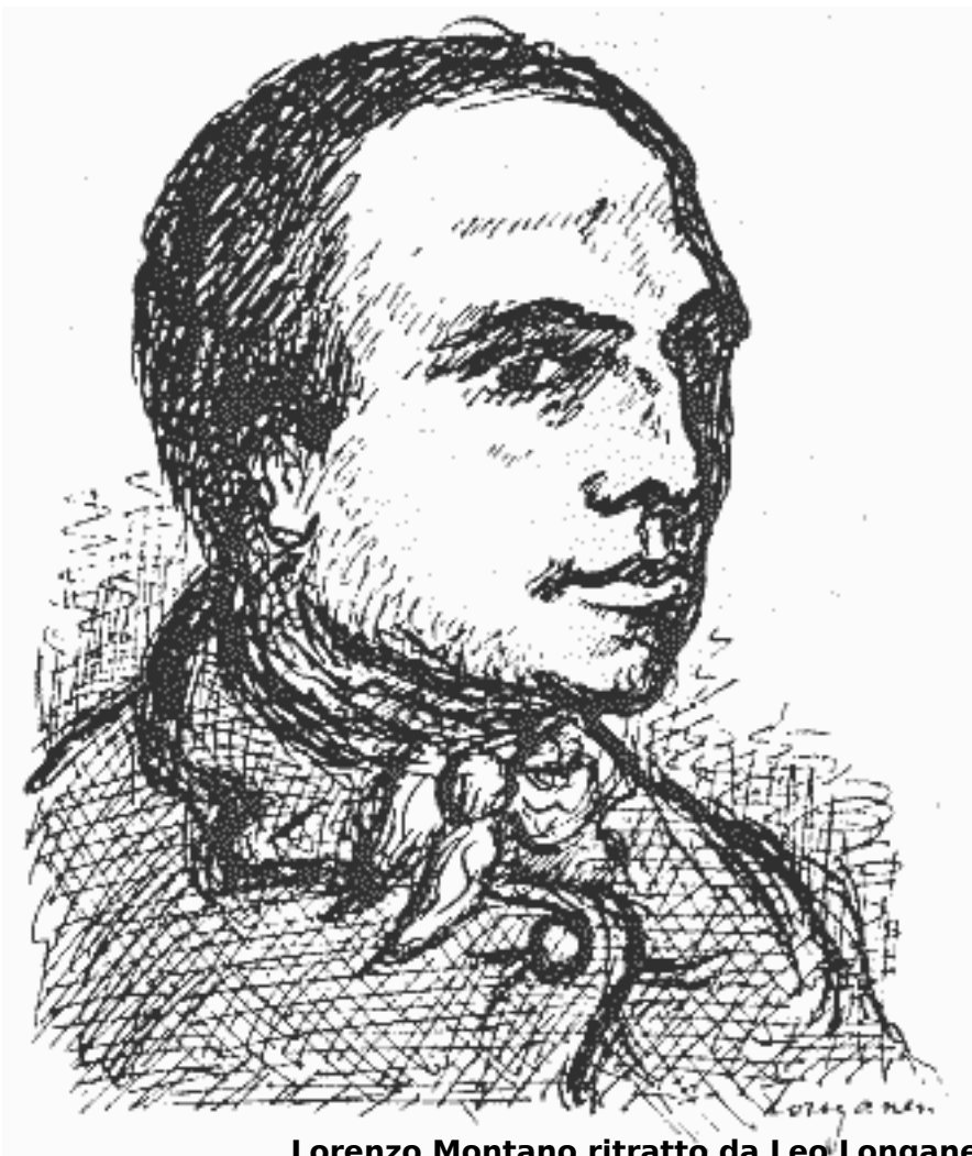
Lorenzo Montano ritratto da Leo Longanesi

Mentre va a concludersi l'attuale Biennale Anterem di Poesia, abbiamo il piacere di presentare il bando della XXIII edizione del Premio Lorenzo Montano, che scadrà il 31 marzo 2009. Tutti i poeti finalisti, segnalati e menzionati per le varie sezioni costituiranno i protagonisti della prossima Biennale, insieme con filosofi, critici letterari, editori, musicisti e videoartisti.